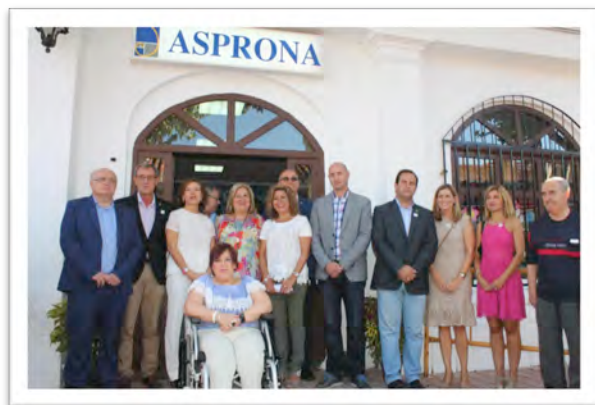
Visita de la consejera de Bienestar Social al stand de ASPRONA en el Recinto de la Feria de Albacete.