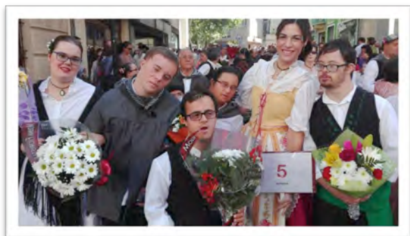
Ofrenda de Flores a la Virgen de los Llanos