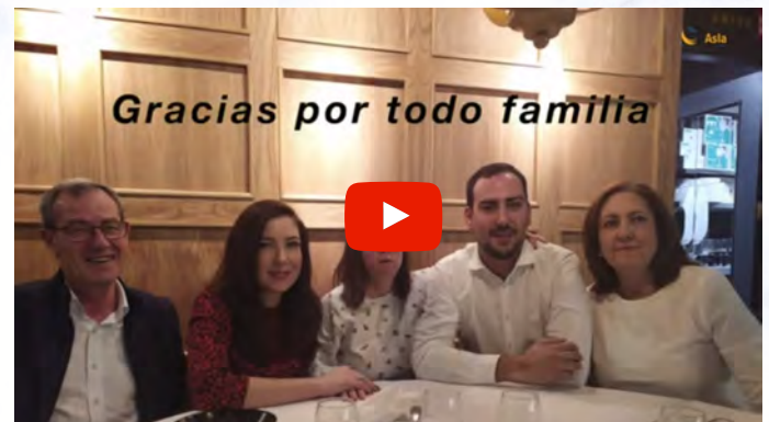
Vídeo de Fundación Asla