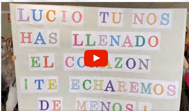
Vídeo de ASPRONA

Como homenaje por su trayectoria en ASPRONA, y a pesar de que la pandemia ha impedido realizar una despedida como se merece, su familia más cercana, junto a multitud de profesionales y personas con discapacidad intelectual o del desarrollo de toda la provincia de Albacete han querido realizar unos vídeos muy emotivos.