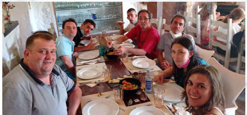
Finaliza el programa de vacaciones de verano de ASPRONA. Entre los destinos que han visitado se encuentran varias zonas del mar Mediterráneo, realizando viajes a La Manga, La Zenia, El Altet y Guardamar del Segura.