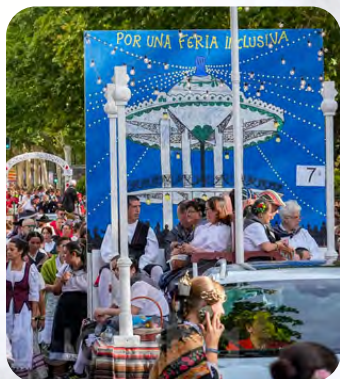
Cabalgata de Apertura