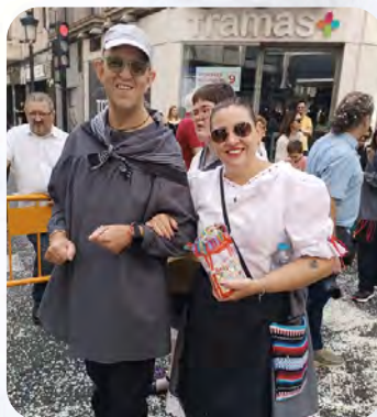
Batalla de Flores