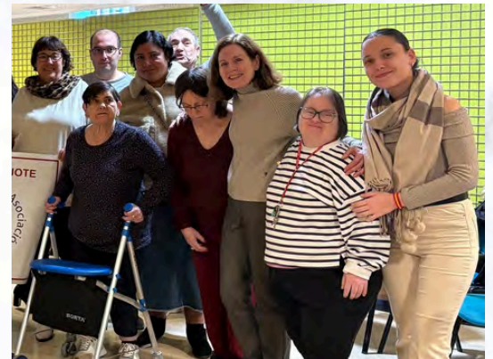
La Residencia Miguel Muñoz disfruta de un encuentro ofrecido por la asociación literaria El Quijote