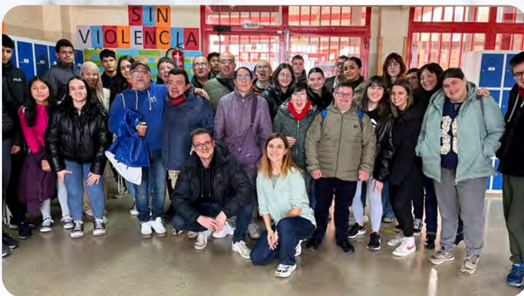
El Centro Ocupacional Eloy Camino realiza una jornada de convivencia con el I.E.S. José Isbert, de Tarazona de la Mancha