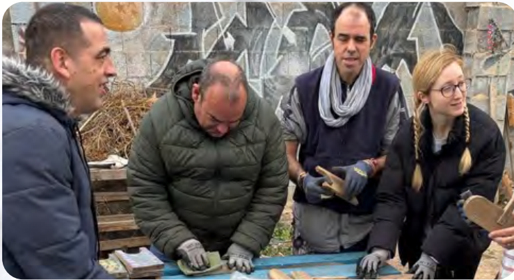
Un grupo del Centro Ocupacional Eloy Camino participa en la siembra colectiva del huerto comunitario del barrio Franciscanos