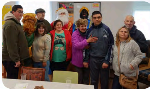
C. Ocupacional Elche de la Sierra