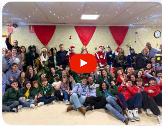
Residencia Miguel Muñoz