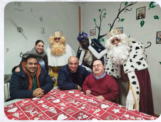
Vivienda con apoyos de Villarrobledo