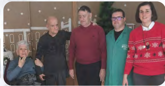
Centro de Día de Caudete