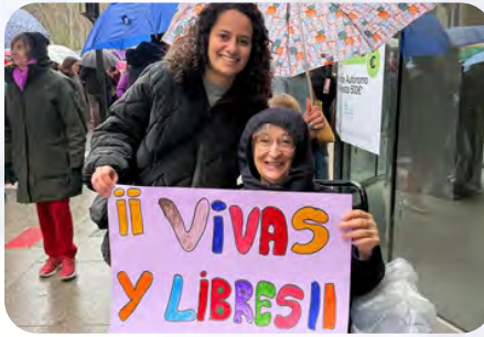
Manifestación de Albacete