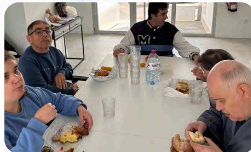
El Centro de Día de Almansa rula la mona