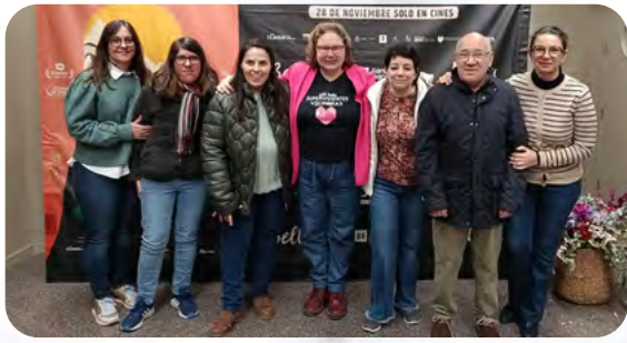
Proyección de Bella en Hellín