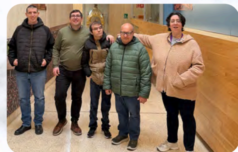
Visita al Museo de la Semana Santa de Hellín