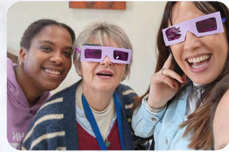
El Centro Ocupacional de Hellín promueve la igualdad