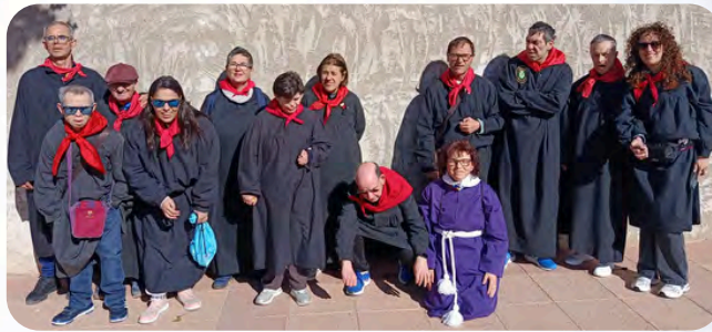
La Residencia de Hellín y el servicio de día participan en las procesiones