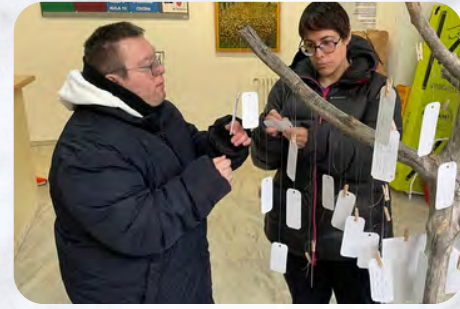
El Centro Ocupacional de La Roda apoya varias actividades