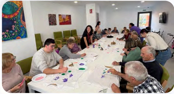
El Centro Ocupacional Elche de la Sierra apoya el Día de la Mujer