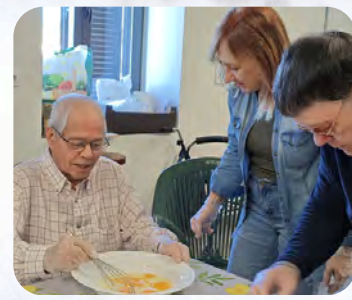
Taller de cocina en La Roda