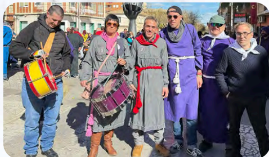
Tamborada de Tobarra