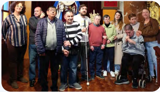
El Centro de Día de Hellín visita a la Cofradía de Ntra. Sra. del Dolor