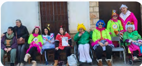
Vivienda con apoyos de Villarrobledo